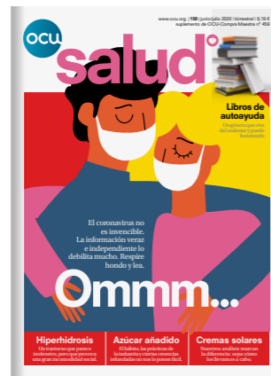
OCU SALUD 6 números al año