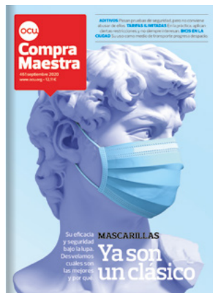
OCU-COMPRA MAESTRA 11 números al año

Cuando es más necesario estar bien informado, acompañamos a los socios con la información veraz y al día de nuestras publicaciones.