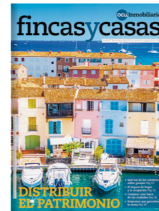
OCU-FINCAS Y CASAS 6 números al año