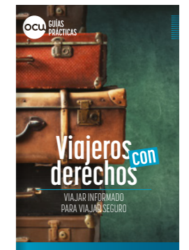
GUÍAS PRÁCTICAS 13 nuevos títulos