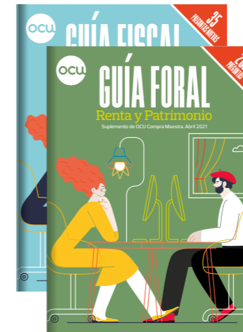
GUÍA FISCAL/FORAL 1 número al año