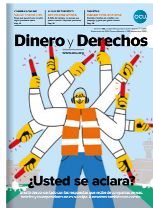
DINERO Y DERECHOS 6 números al año