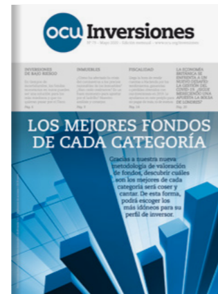
OCU-INVERSIONES 11 números al año