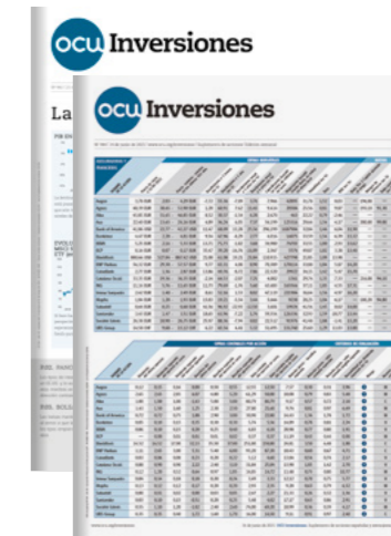
OCU-INVERSIONES Suplemento semanal